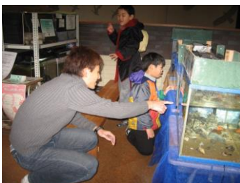
係のお兄さんが生き物のことをやさしく教えてくれました

冬休みのある日、加賀市にある鴨池センターにお弁当を持って出かけました。センターには鳥の巣、剥製、池に棲む生き物の水槽などがたくさん展示されていました。みんな興味津々な様子で触ったり見たり！あたたかくなったら望遠鏡を持ってまた来たいね、と話していました。