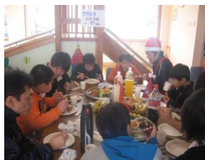
会話がはずむランチタイム！

初めてのパーティースタイルでスタッフは心配していましたが、心配をよそにオードブルから好きなものを選んで紙皿にとって食べ、ゲームの順番はならんで待ち、おはなしの間は静かに座ってきいていられました。そんな子ども達の姿を見ることができ、日頃の積み重ねが大事だな、とあらためて感じました。