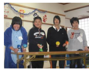
ハンドベルの発表をしたよ。