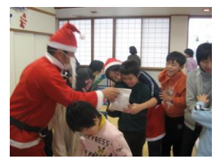
サンタさん、ありがとう♡