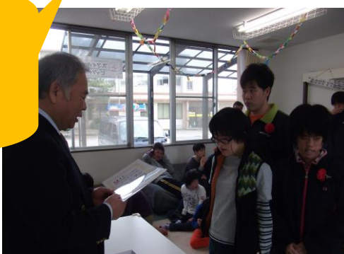
↑卒業生には「卒すまいる証書」を授与〜