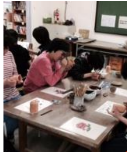
←5/16、レクリエーション in 陶芸村、で絵付け体験^ ^