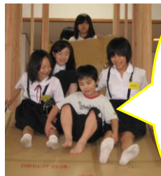
いっしょにすべり台 すべろうよ！