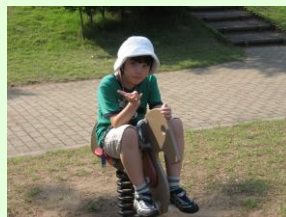
カメラ目線ではい、チーズ☆