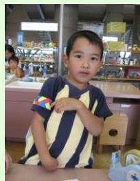
腕章かっこいいでしょ?