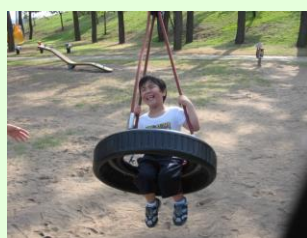
「気持ちいい。もっと押してー!」