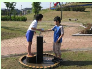
とっても仲良しな二人です(^_^)