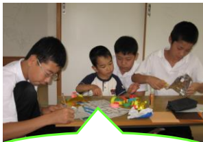
お兄ちゃん、作ってえ

6年生の児童たちは、利用者が取り組みやすいようにシールを貼る飾り付けや、はさみで切るところには印を付けて準備してきてくれました。初めはどう関わっていいのか考え込んでいた児童も、次第に緊張がほぐれ積極的な声かけが聞かれ始めました。それに合わせるかのように、利用者も飾り作りの活動にそれぞれのペースにあわせて取り組めていました。子ども同士、ふれあう回数を重ね名前を呼び合い、追いかけてごっこをする姿から、今回の交流の成果を垣間見た気がしました。