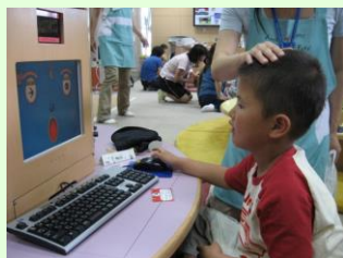
パソコンに夢中です

お小遣いを持ってコンビニで買い物をし、住民会議の車をお借りしてクレヨン公園(金津)やテクノポート(三国)、エンゼルランド(春江)におでかけしました。その時の様子を一部ご紹介します。