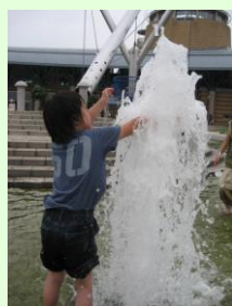
噴水を見たら触りたくなっちゃった