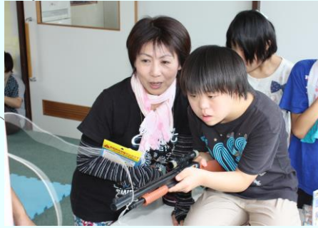
↑「お母さんと一緒だと100倍楽しい♥」→

今年の夏休みは毎日25名前後の子どもたちが元気いっぱいに来所し、過去最高の賑やかさになりました。お約束のプールやかき氷はもちろん、電車外出や調理、手芸作品作り、農園でのお仕事体験など、学年や能力に合わせた個別企画を通して、笑顔だけでなく、頼もしい面もたくさん見せてくれました。